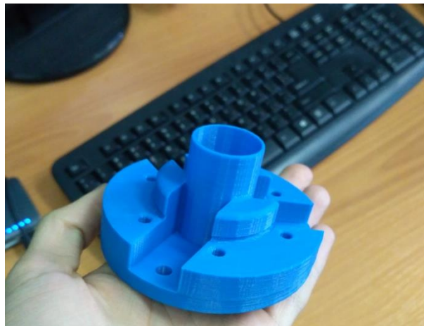
Макет корпуса из ABS-пластика